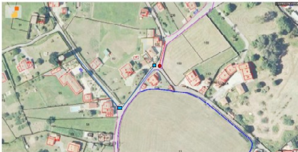
Esquema redes existentes abastecimiento y saneamiento fecales.